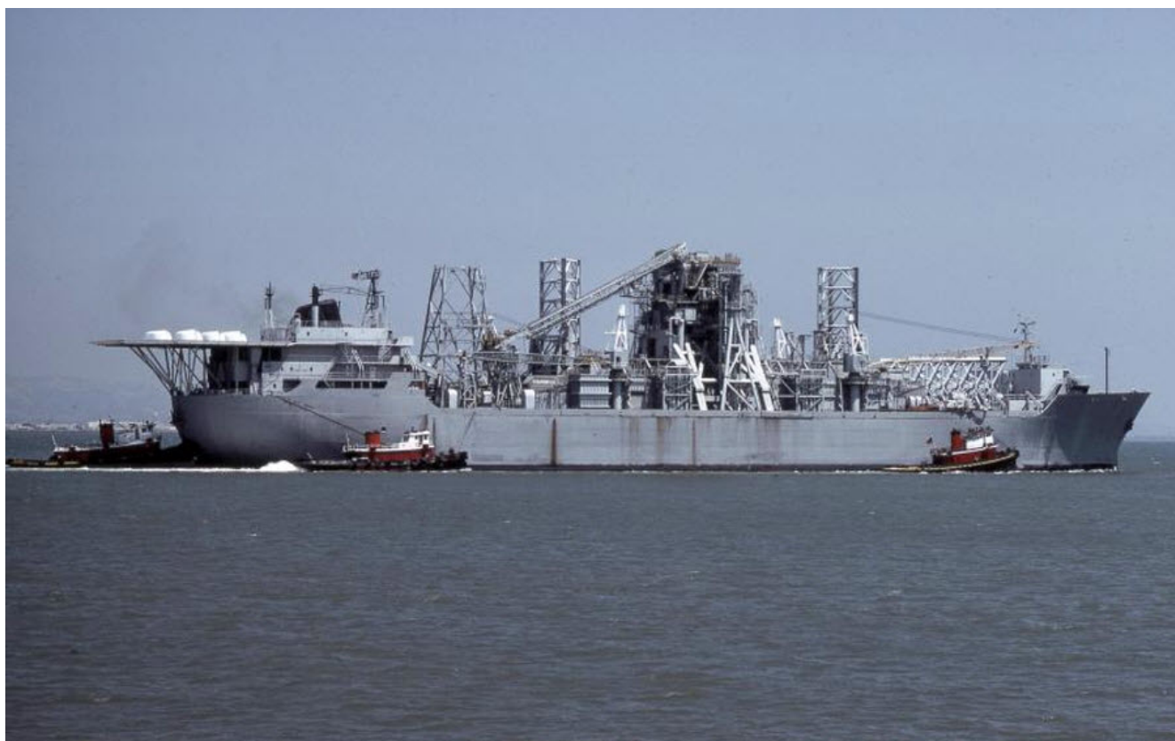
USNS GLOMAR EXPLORER AG193_2.

Но план ЦРУ – поднять всю советскую подлодку целиком, все еще нравился Никсону и Киссинджеру, который теперь стал государственным секретарем. В свой план ЦРУ посвятили также нескольких лидеров конгресса США.