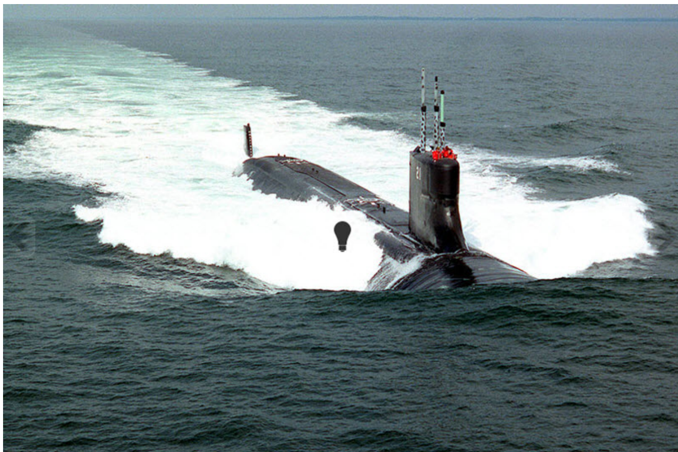
US Navy Sea wolf Submarine.

В конце 1974 года, за несколько месяцев до того, как Колби предпринимал отчаянные попытки сохранить в тайне намерения совершить вторую попытку, ВМС еще раз направили подлодку «Сивулф» на место гибели советской лодки.