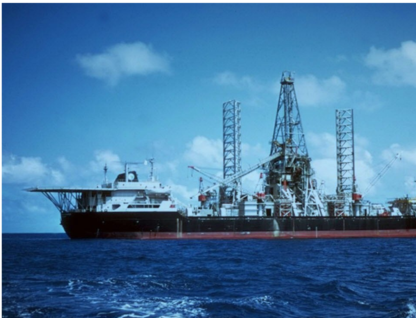
USNS GLOMAR EXPLORER AG193_4.

Но как достичь корпуса лодки? Это было, по мнению одного из членов экипажа «Гломар», все равно что пытаться поднять огромную стальную трубу с грунта тросом, спущенным с крыши 110-этажного небоскреба в кромешной темноте при сильных порывах ветра.