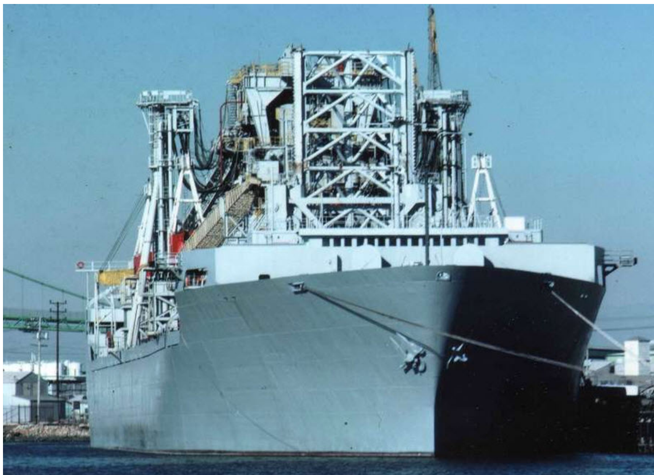
USNS GLOMAR EXPLORER AG193_1.

Новость о том, что Херш прослышал что-то о проекте «Дженнифер», произвела в ЦРУ эффект разорвавшейся бомбы. Колби знал, что Херш удостоился премии Пулитцера за предание гласности сведений о кровавом побоище над мирными жителями, устроенном американскими солдатами в деревне Ми Лай. Поэтому директор ЦРУ считал его «хорошей ищейкой». Колби понимал и другое: за 6 лет планирования и подготовки секретной операции все тайное так или иначе может стать явным.